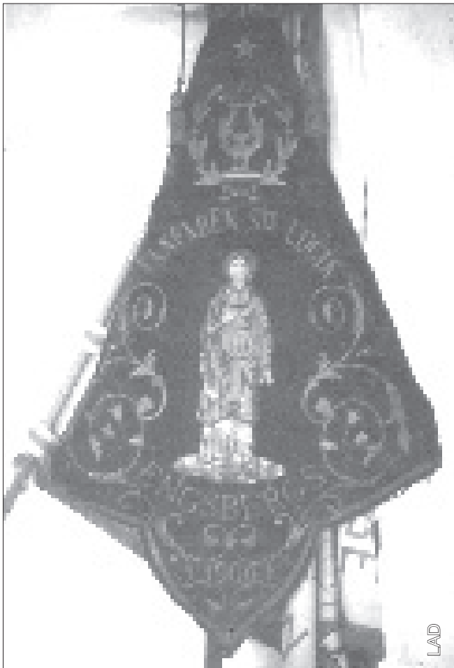
De Sint-Luciafanfare werd opgericht op 16 oktober 1898. Het vaandel dateert uit 1900.